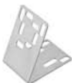
Montagewinkel für Cube Art.-Nr. 8605963